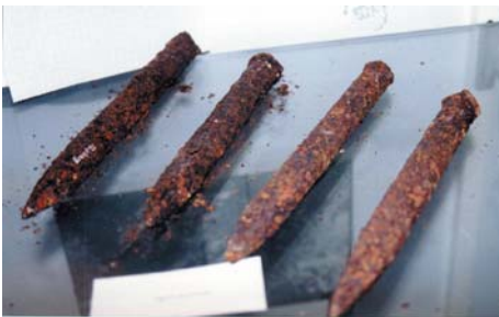
oben: römische Keile zum Spalten des Gesteins, gefunden im Felsberg und ausgestellt im früheren Museum in Beedenkirchen rechts: 1800 Jahre später - Bolzen zum Befestigen von Drahtseilen zum Abtransport von Werkstücken aus den Felsberg-Steinbrüchen der Zeit bis 1979

Der ehemalige Geschäftsführer im FIZ Günther Dekker hat zur Ergänzung der