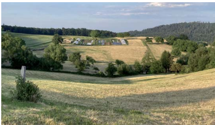
Die Ästhetik der Natur: auch Gemüse hat einen hohen Wert - auf dieser Fläche (mittig oben) wird Gemüse für 100 Haushalte angebaut!

Mit diesem Verbot des Grünlandumbruchs sollen ökologisch wertvolle Flächen in der Agrarlandschaft erhalten werden. Es dient jedoch vor allem dazu, den Anbau von Futterpflanzen (außer Wiesengras) und Energiepflanzen einzudämmen. Grünland hat laut Umweltbundesamt vor allem einen "hohen ästhetischen Naturwert" für Freizeit und Erholung, bietet aber auch wichtige Flächen für den Erhalt der Artenvielfalt Bitte lesen Sie weiter auf S. 4