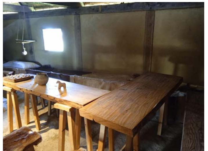
Wohnraum mit Schlafstätten und offener Feuerstätte in der Mitte, Abzug durch das Strohdach. Die Fenster wurden bei Kälte durch Holzläden verschlossen, kostbare durchscheinende ölgetränkte Haut für Fenster gibt es in Lauresham nur in der Kapelle.