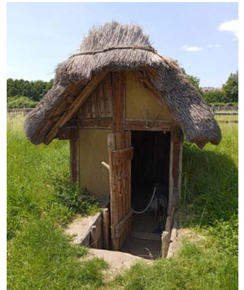
=ben: frühmittelalterliche Werkstatthütte; Fachwerkbauweise mit Strohdachung. Das sogenannte Grubenhaus wurde einem archäologischen Befund nachempfunden

Wobei man bei der Wärmedämmung keine Probleme hatte: die Wände bestehen aus Flechtwerk, das im Kern eine Strohfüllung hat, und entsprechen so trotz historischer Genauigkeit der modernen Norm. Zwischen 2012 und 2013 wurden die Häuser erbaut und halten etwa 30 Jahre. War im Mittelalter Bitte lesen Sie weiter auf S. 7