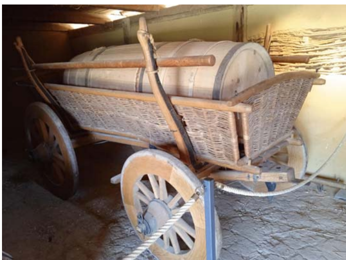
Güllewagen; er wurde in Lauresham so gebaut, daß er funktioniert. Nur auf diese Weise entsteht eine Vorstellung, wie er vor 1200 Jahren tatsächlich ausgesehen haben könnte...