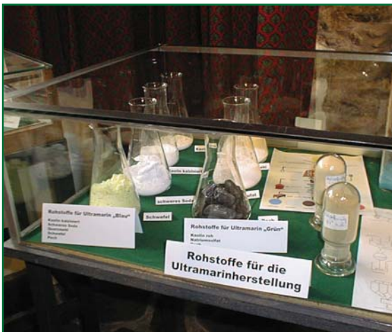
Das Heimatmuseum enthält viele Schaustücke aus der alten Blaufabrik in Lautern, wo das berühmte „Waschblau“ hergestellt wurde