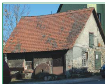
Die alte Roß-Schmiede in Gadernheim - 1999 und 2011

heim, mundartlich Gaarene und wurde vermutlich um das Jahr 800 als Sicherung der Wasserrechte an der oberen Lauter durch das Kloster Lorsch gegründet. Der Bensheimer Historiker Heinrich Tischner ( www.heinrich-tischner.de ) fand heraus, daß im 15. Jahrhundert die Schreibung unsicher wird: mal schrieb man Geidenau, mal Gadern und seit 1605 Gadernheim. „Diese merkwürdige Unsicherheit lässt sich nur dadurch erklären, dass der Ort eine Zeitlang unbewohnt war (wohl im selben Krieg im Jahre 1504 wie Hüppelnheim bei Lengfeld zerstört). Die Menschen, die in den Ort zurückkehrten, kannten zwar noch den Namen, wussten aber nicht mehr, wie man ihn schreibt.“ Spätestens der 30-jährige Krieg hat alles ausgelöscht, die Bevölkerung und ihre Spuren.