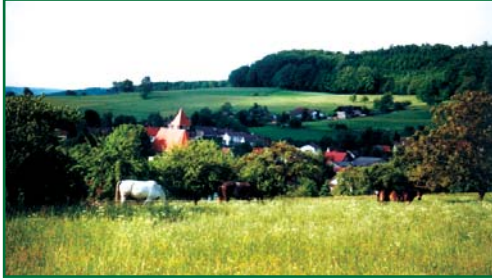
Blick auf Gadernheim und seine im Jahr 1912 von dem Bensheimer Architekten Prof. H. Metzendorf entworfene Kirche