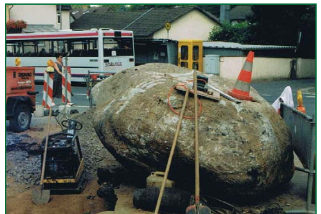
Dieser 8 Tonnen Felsbrocken wurde bei Straßenbauarbeiten im Jahr 1997 gehoben

Die Nibelungenstraße - heute teilt sie unsere Gemeinde in Nord und Süd, war gar nicht die älteste und wichtigste Verbindung. Die Straße von Brandau ist genau fünf Jahre älter. Sie ist eine Provinzialstraße und führte von Roßdorf zum Gumper Kreuz. Fertiggestellt wurde sie 1843. Davor muß man sich Reisen von einem Ort in den anderen als ziemlich matschige und beschwerliche Angelegenheit vorstellen. Erst 1848 wurde die Straße nach Bensheim gebaut, die Bauplätze entlang der Straße wurden zum Teil verschenkt. (mh)