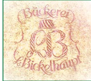
Alte Zeiten: wunderschöne Fassadenarbeit für eine längst vergangene Bäckerei - heutzutage halten Geschäftslogos nicht mehr so lange...

Aschaffenburg, zum Teil entlang des bereits im Lorscher Kodex beschriebenen Grenzverlaufs der Basinsheimer Mark. Über das Wegerecht z.B. auf der breiten Heide ("braad Haad") gibt es Verträge, die 400 Jahre alt sind. Hier in der Nähe, im Wald "am Hinkelstein" soll alten Geschichten zufolge früher einmal ein Hünengrab gewesen sein. Doch seit fast einem Jahrhundert wurden hier Steine gebrochen, so daß mögliche Spuren nicht mehr auffindbar sind. Die ältesten Grenzsteine jedoch, die auffindbar sind, stammen aus dem Jahr 1739 und sind in Grimms Karten verzeichnet.