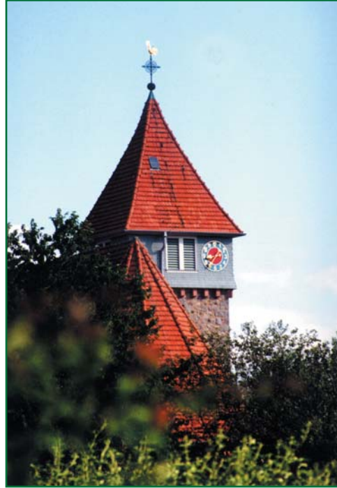
Die Kirche in Gadernheim