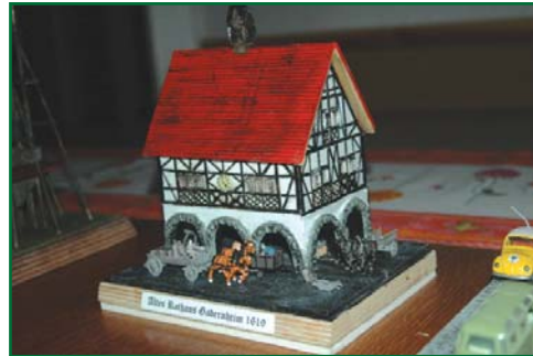
Das Rathaus als Modell von Peter Elbert