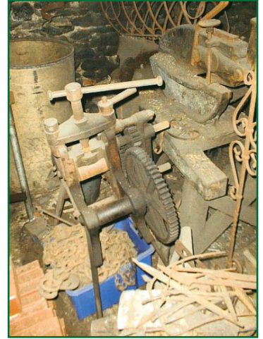
Die Radbiege in der alten Schmiede Gadernheim