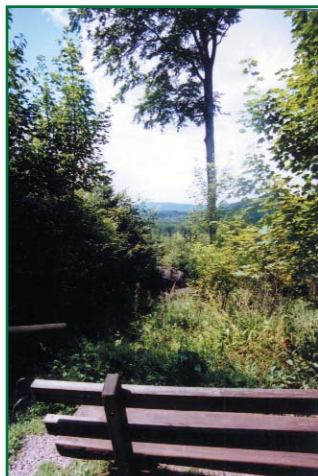
Blick vom Hexenstein auf der Neunkircher Höhe