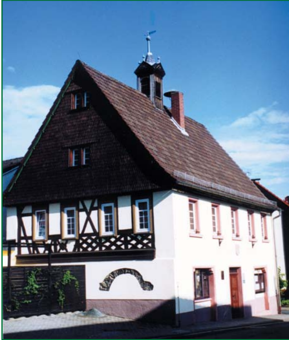
Das alte Rathaus - heute Heimatmuseum Unten eine Fensterscheibe mit Wappen