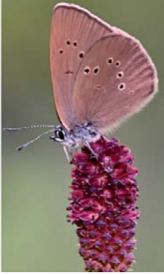
Dunkler Wiesenknopf-Ameisenbläuling

https://rp-darmstadt.hessen.de/umwelt-und-energie/naturschutz